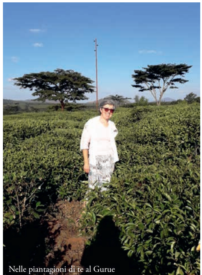
Nelle piantagioni di tè al Gurue